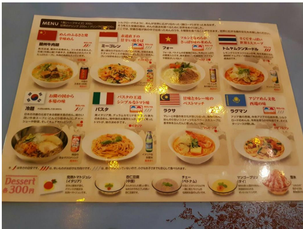
食器返却口和菜單