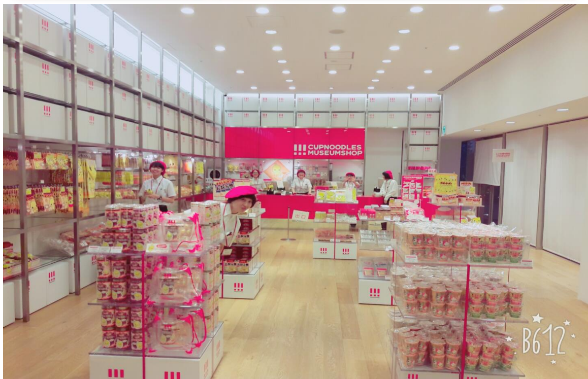
這2張圖則是1樓的商品販賣店與服務櫃台