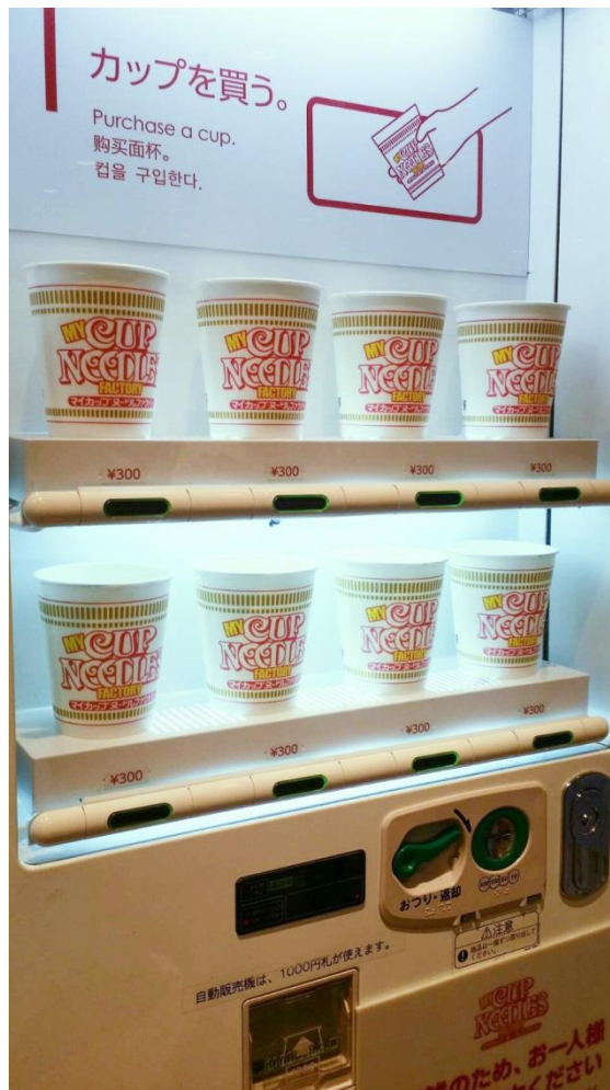
這是販賣杯麵杯子的販賣機與入場票是否還有的螢幕