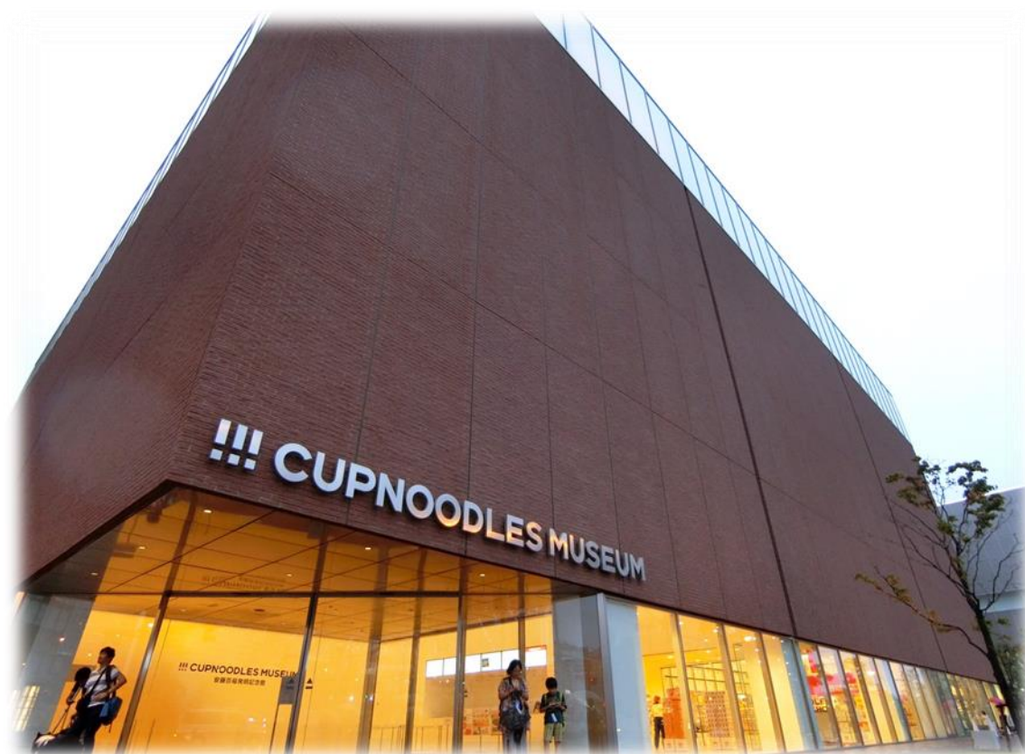
這是公司正門的外觀