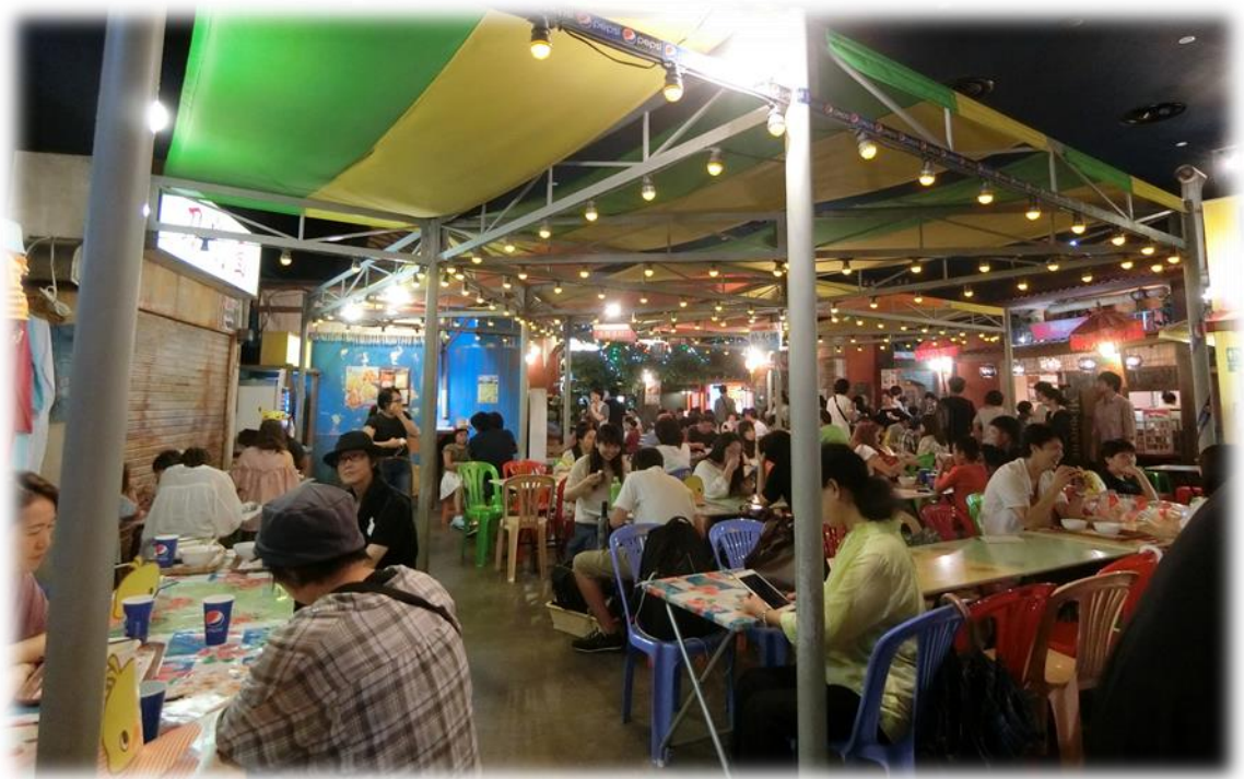
這裡是 4 樓餐廳的正門外觀和內部外觀